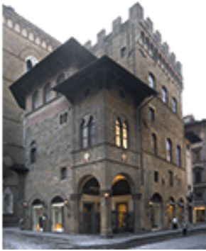
Il Palazzo dell'Arte della Lana

The wool industry was also tied to the exploitation of alum mines. This mineral made it possible to fix a dye on fabric by means of a procedure in which the Florentine workshops excelled, the secret of which has been lost. Genoa which had the monopoly on the diffusion of alum in Europe, imported it from Asia Minor until the Ottoman conquest made it necessary to find other supply sources. In 1461, a new deposit was found in Tolfa, situated about seventy kilometres northwest of Rome: the Medici succeeded in obtaining exploitation rights, but in 1476 the rights were acquired by their rivals, the Pazzi.”