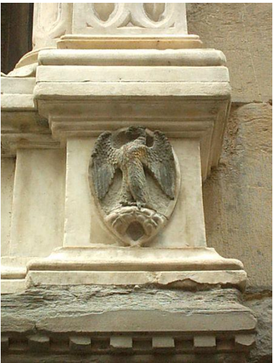
Vapensköld Stemma dell'arte di Calimala