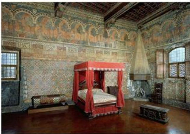
Sala dei Pappagalli / Papegojrummet.

cotto /tegel och tak i trä, några dekorerade med målningar. Några av rummens väggar är målade med fresker och dekorationer föreställande gardiner/vävar och vapen vilket var populärt i ett Florentinskt 1300-talshem. Det vackraste rummet är