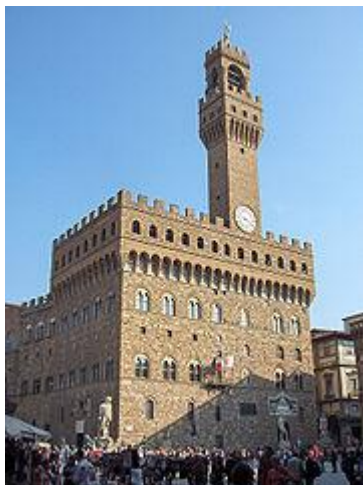
Rådhuset, Palazzo Vecchio Adress: Piazza della Signoria

Palazzo Vecchio , Piazza della Signoria. Herrarna som var medlemmar av rådet kallades i signori , där av namnet. Rådhuset uppfört 1299 var säte för skråna i Florens. Då, liksom idag fungerar det som platsen för regionens regering och är hjärtat för Florentinsk kultur. Det var här som stadens 5000 skråmedlemmar hade makten att rösta och samlades till diskussioner och bestämde stadens frågor.